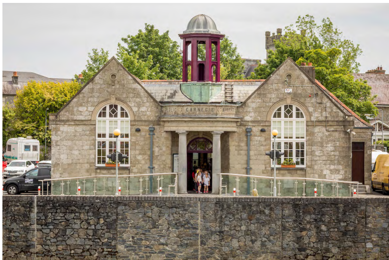
Leabharlann Carnegie Chill Chainnigh: Spás Cultúir i gCathair Chill Chainnigh Library: A Cultural Space in Kilkenny City