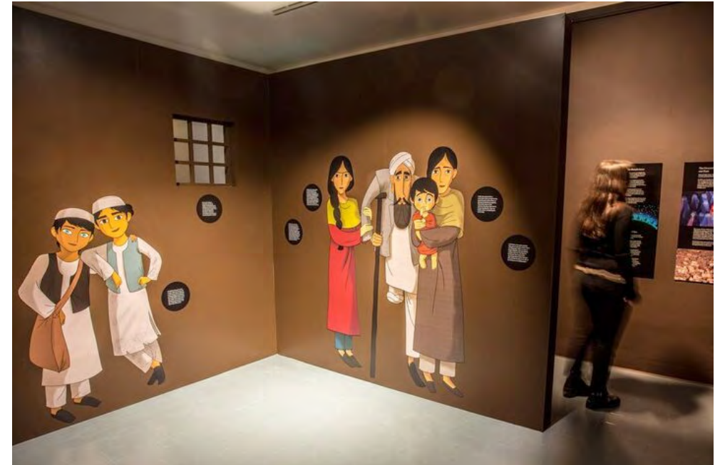
The Breadwinner Exhibition i nGailearaí na mBuitléarach: taispeántas idirghníomhach, ilmheán agus líníochtaí bunaidh ann de chuid an stiúideo beochana Éireannaigh Cartoon Saloon atá lonnaithe i gCill Chainnigh agus a ainmníodh faoi thrí i gcomhair Oscar© The Breadwinner Exhibition at the Butler Gallery: an interactive, multi-media exhibition with original drawings from the Kilkenny-based and thrice Oscar© nominated Irish animation studio Cartoon Saloon