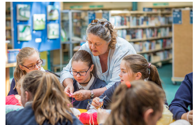
Mic léinn cniotáil á foghlaim acu le linn Fhéile Bhealtaine Students learning to knit at the Bealtaine Festival

The core values underpinning that role include the intrinsic value of culture and creativity, the economic value for individuals and communities, the enhancement to quality of life, health and well being on a personal and collective level, the promotion of civic participation and cohesion and better sense of place and identity. It is our primary objective to make cultural and creative activities accessible to all communities, especially our rural communities through increased engagement and improved facilities to build a creative community for our county.