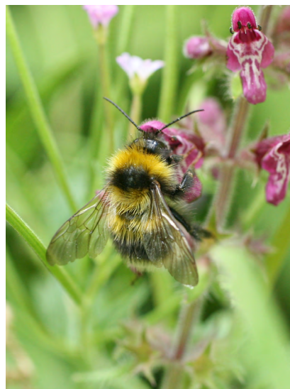
An bhumbóg gharraí ( Bombus hortorum ) – clár Bithéagsúlachta Eolaíochta do Shaoránaigh trína ndéantar ár n-oidhreacht shaibhir nádúrtha a thairfeadh Garden bumblebee ( Bombus hortorum ) – Kilkenny's Citizen Science Biodiversity programme recording our rich natural heritage