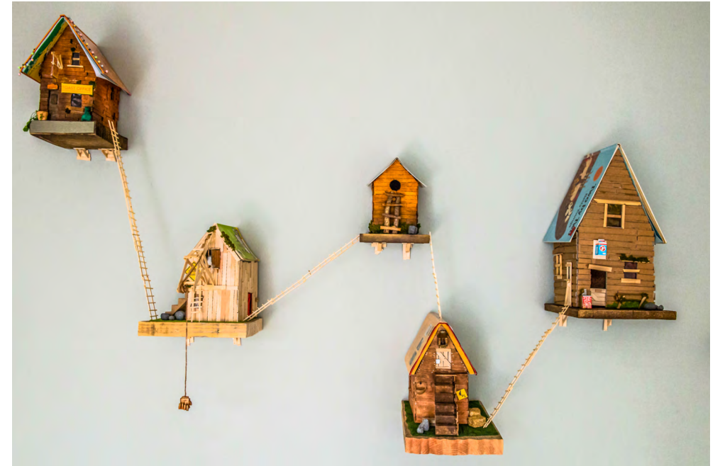
Bookvillas, Taispeántas Fhéile Bookville, 2017. (An tEalaíontóir Mick Minogue. An Grianghrafadóir Ian McDonnell) Bookvillas, Bookville Festival Exhibition, 2017. (Artist Mick Minogue. Photographer Ian McDonnell)

The Conservation Office and Architect Office of Kilkenny County Council also play an important role in cultural service delivery in the county. Together the Kilkenny County Council Cultural Services Team promotes and supports Kilkenny's cultural and creative resources, thus reflecting and implementing the vision of Creative Ireland.